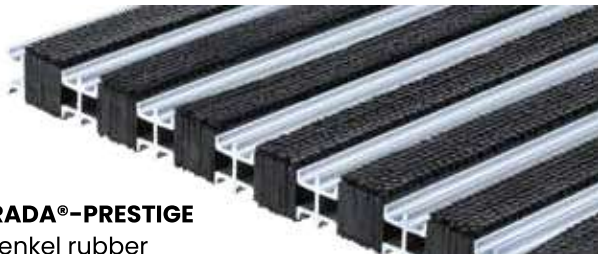
ENTRADA®-PRESTIGE met enkel rubber