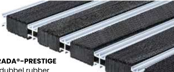
ENTRADA®-PRESTIGE met dubbel rubber