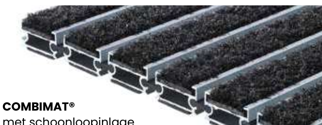
COMBIMAT® met schoonlooptapijt