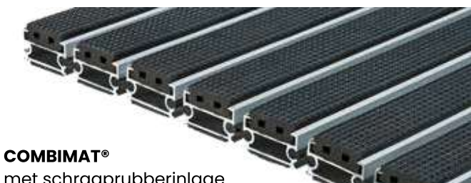
COMBIMAT® met schraaprubberinlage