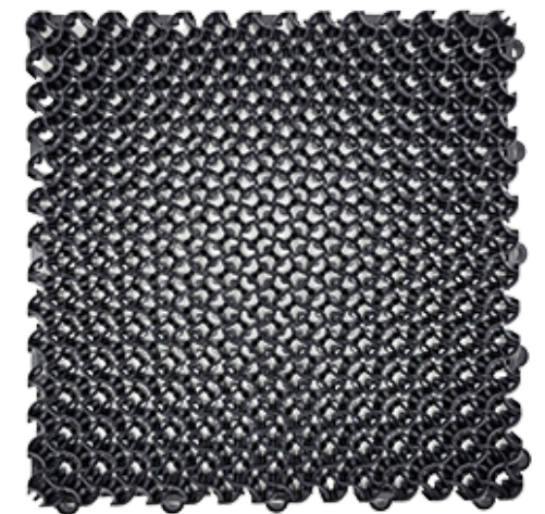
EMMAT ECO MODULAIRE TEGEL 8300 SCHRAAPTEGEL