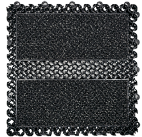
EMMAT ECO MODULAIRE TEGEL 8900 VOORZIEN VAN FORZA AQUA 85 DROGENDE TAPIJTINLAGE