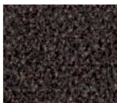
marron n° 7132