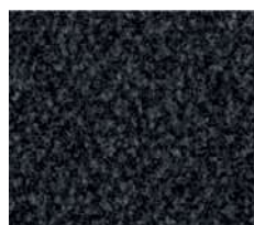
noir n° 7130