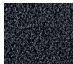
gris n° 7135