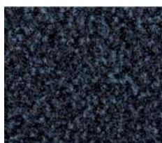
bleu n° 7136