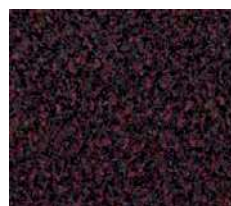
rouge n° 7139