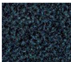
vert n° 7137