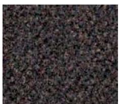
marron ardoise n° 7131