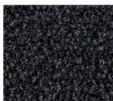
marron foncé n° 7134